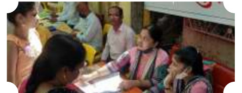
ग्राहकांना मार्केटिंग द्वारे विविध योजनांची माहिती