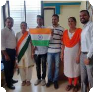
बँकेच्या कर्मचाऱ्यांनी साजरा केलेला प्रजासत्ताक दिन